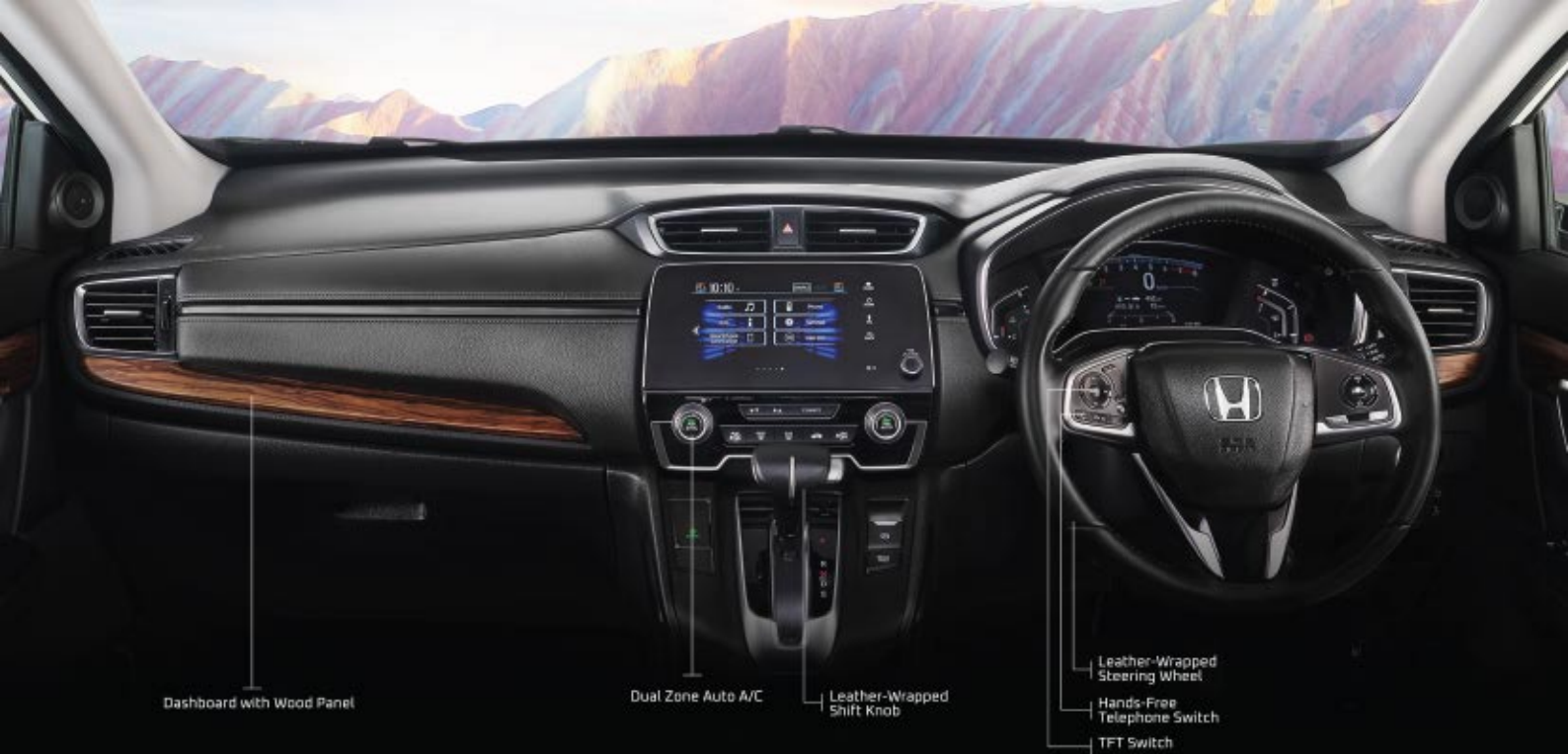
Dashboard with Wood Panel