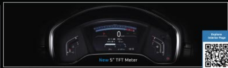
New 5" TFT Meter