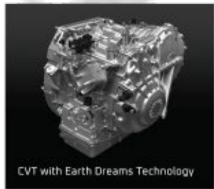
CVT with Earth Dreams Technology