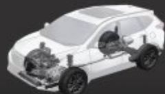
MacPherson Strut & Multi Link Suspension