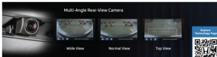
Multi-Angle Rear-View Camera