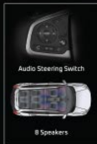
Audio Steering Switch