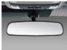
Day/Night Rear-View Mirror