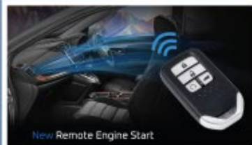
New Remote Engine Start