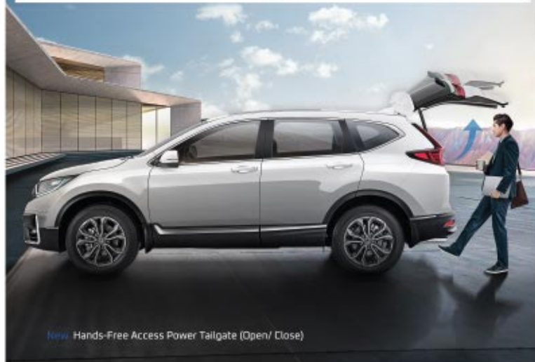
New Hands-Free Access Power Tailgate (Open/Close)