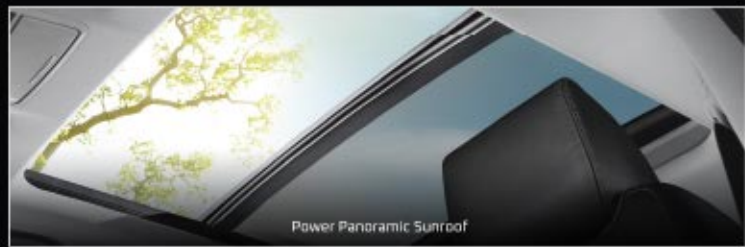
Power Panoramic Sunroof