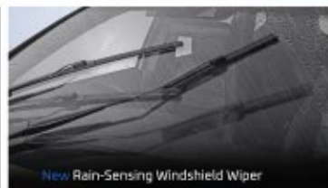
New Rain-Sensing Windshield Wiper